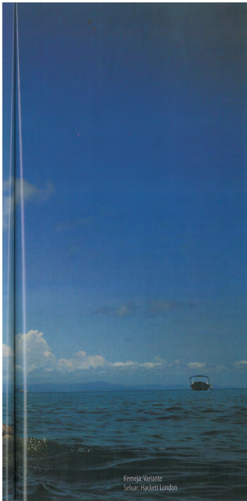
Kemeja: Variante Seluar: Hackett London